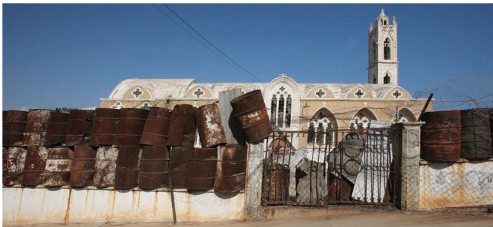
Εκκλησία Αγίας Ζώνης εντός της περικλειστης πόλης της Αμμοχώστου