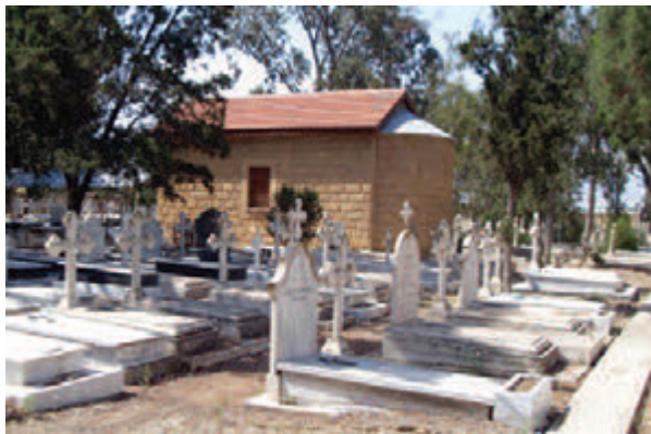
• Το παρεκκλήσι της Αγίας Αναστάσεως στο κοιμητήριο του Αγίου Δομετίου (2010).