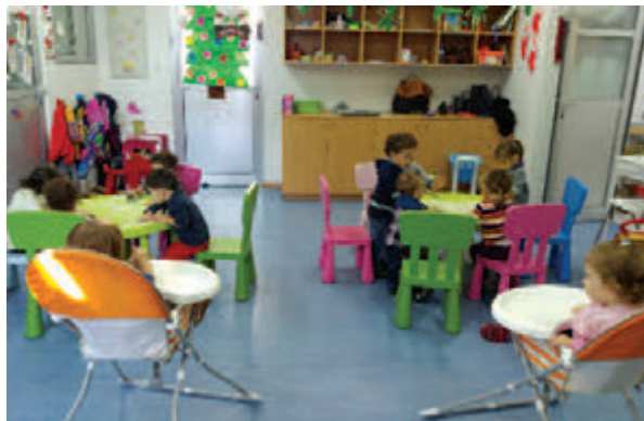
● Μάθημα στο Αρμενικό Κέντρο Παιδικής Φροντίδας «Νανόρ» (2015).

Το διάσπμο Εκπαιδευτικό Ινστιτούτο Μεϊκονιάν κτίστηκε μεταξύ 1924 και 1926 χάρη στη γενναιόδωρη και φιλάνθρωπη δωρεά των καπνεμπόρων αδελφών Κρικόρ και Καραμπέτ Μεϊκονιάν, αρχικά για να στεγάσει περίπου 500 ορφανά της Αρμενικής Γενοκτονίας. Το άλσος μπροστά απ' αυτό φυτεύτηκε από τα πρώτα εκείνα ορφανά, εις μνήμην των χαμένων συγγενών τους. Εξεήλθηκε από ορφανοτροφείο (1926-1940) σε μια φημισμένη δευτεροβάθμια σχολή (1934-2005) με οικοτροφείο. Ένα μοναδικό και απaráμιλλο επίτευγμα, το Μεϊκονιάν υπήρξε φάρος ελπίδας και πολιτισμού για τον απανταχού αρμενισμό και την ανά τον κόσμο αρμενοφωνία. Μπορούσε να καυχείται για μια διεθνή συμμετοχή Αρμενίων μαθητών από ολόκληρη την υφήλιο και ορθά αποκαλείτο πρεσβευτής της Κύπρου στην οικουμένη. Εκτός από την πλούσια βιβλιοθήκη και τα άρτια εξοπλισμένα εργαστήριά του, το Μεϊκονιάν διέθετε θεατρική και χορευτική ομάδα, χορωδία, φιλαρμονική, ομάδες ποδοσφαίρου, καλαθόσφαιρας και πετόσφαιρας, καθώς και το ιστορικό 7 ο Σύστημα Προσκόπων Κύπρου και την 9 η Ομάδα Οδηγών Κύπρου.