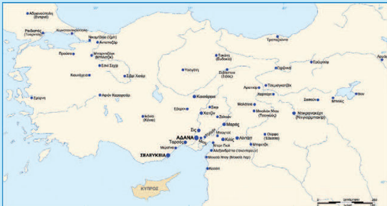
Χάρτης με τους τόπους προέλευσης των Αρμενοκυπρίων

Σχεδιασμός του χάρτη από τον Αλέξανδρο-Μιχαήλ Χατζηλήρα