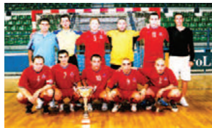
• Η πρωταθλήτρια και κυπελλούχος ομάδα φούτσαλ AGBU-Αραράτ (2007).