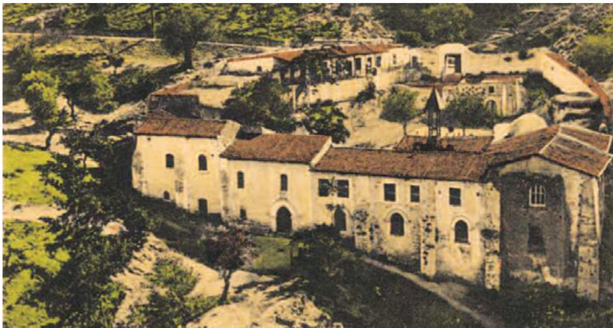
● Ταχυδρομικό δελτάριο που απεικονίζει το Ξακουστό Μοναστήρι του Αγίου Μακαρίου (1926).

Λατινοκρατία: Μετά την αγορά της Κύπρου από τον τιτουλάριο Φράγκο Βασιλιά της Ιερουσαλήμ Γκυ ντε Λουζινιάν το 1192, έλαβε χώρα μια μαζική μετανάστευση Αρμενίων και άλλων αστών, ευγενών, ιπποτών και πολεμιστών από τη Δυτική Ευρώπη, την Κιλικία και το Λεβάντε, στους οποίους παραχωρήθηκαν απλόχερα φέουδα, τιμάρια και προνόμια. Λόγω της εγγύτητάς τους, των εμπορικών τους δεσμών και μιας σειράς γάμων, τα Βασίλεια Κύπρου και Κιλικίας αλληλοσυνδέθηκαν αναπόσπαστα. Στους μετέπειτα αιώνες, χιλιάδες Κιλικιοαρμένιοι αναζήτησαν καταφύγιο στην Κύπρο διαφεύγοντας από τις μουσουλμανικές ορδές και επιθέσεις. Λόγω της συνεχούς παρακμής της Μικρής Αρμενίας, ο τελευταίος της Βασιλιάς, Λέων Ε΄, κατέφυγε στην Κύπρο το 1375. Μετά το θάνατό του στο Παρίσι το 1393, ο τίτλος και τα προνόμιά του μεταβιβάστηκαν στον εξάδελφό του, Βασιλιά Ιάκωβο Α΄ Λουζινιανό, στον καθεδρικό ναό της Αγίας Σοφίας το 1396· ακολούθως, ο βασιλικός θυρεός έφερε και το λείοντα της Αρμενίας.