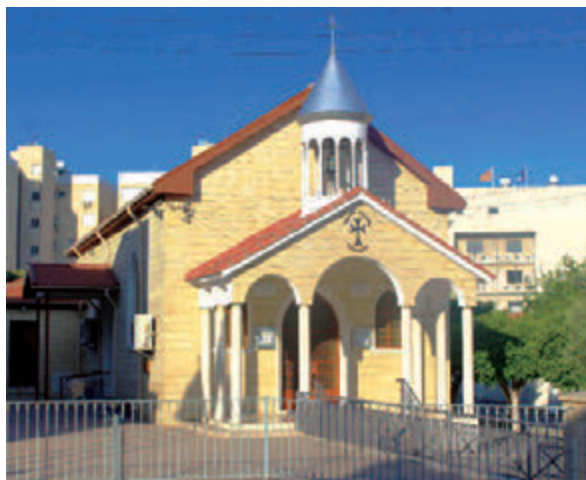
• Η εκκλησία του Αγίου Γεωργίου στη Λεμεσό (2016).