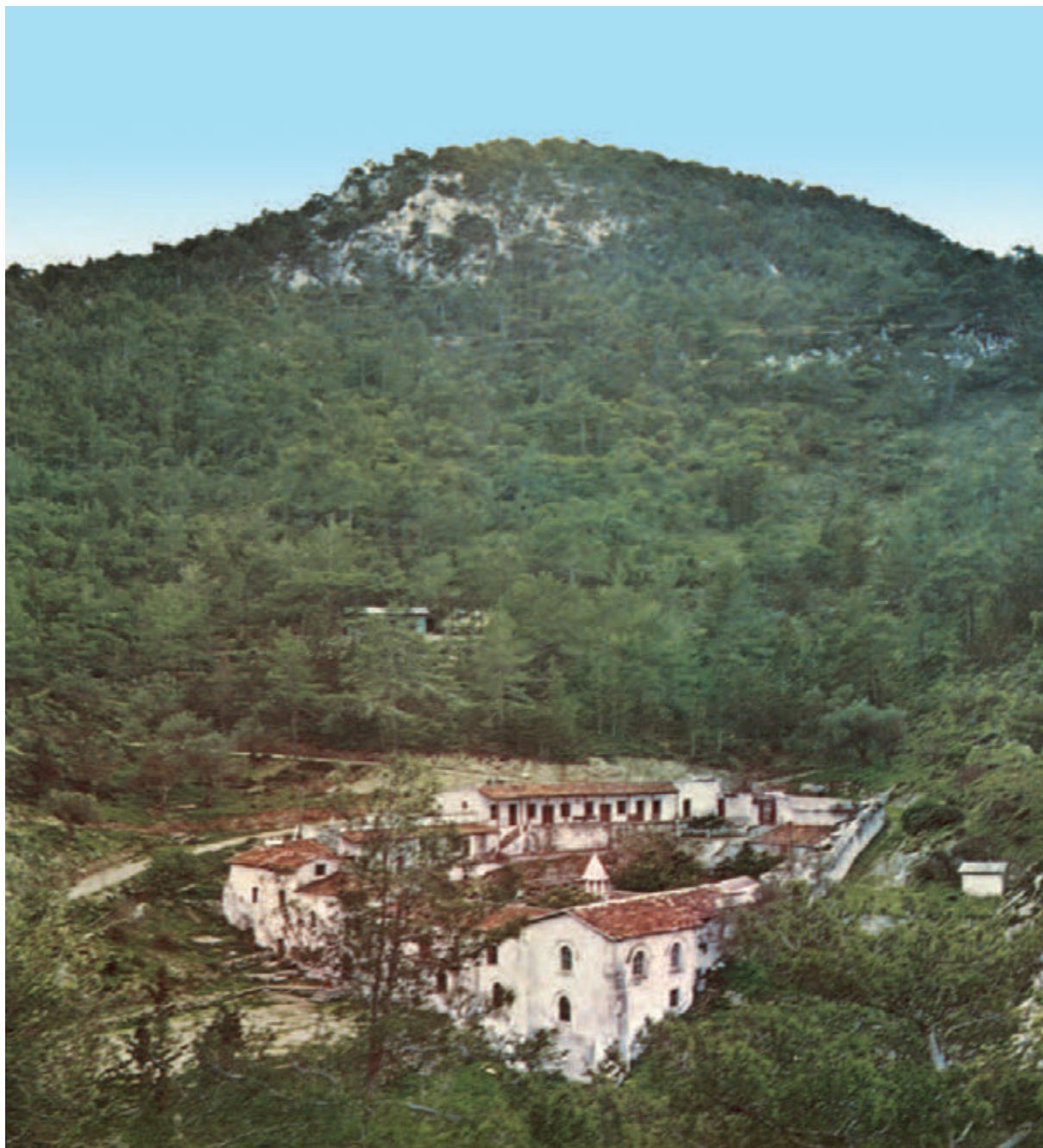
● Το Μοναστήρι του Αγίου Μακαρίου (Μαγκαραβάνκ ĩ Σουρα Μαγκάρ) το 1967.