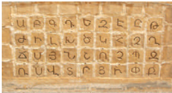
• Το μνημείο για το Αρμενικό Αλφάβητο στο Ινστιτούτο Μελκονιάν.