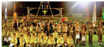
• Το 77 ο Σύστημα Προσκόπων Κύπρου (Χομενετμέν-ΑΥΜΑ: 2015).