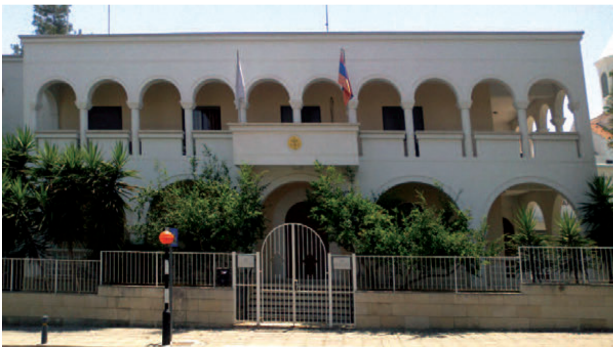
● Η Αρμενική Μητρόπολη (2013).

Το Καταστατικό της Μητρόπολης αποτελείται από 79 άρθρα και, στην παρούσα μορφή του, ισχύει από το 2010. Τη διοίκηση ασκεί η Αρμενική Εθναρχία (Αζκαϊν Ισχανουτιούν) μέσω του Θρονικού Συμβουλίου (Γερεσποχαναγκάν Ζιογόβ) και του Εκτελεστικού Συμβουλίου (Αζκαϊν Βαρτσιουτιούν). Υπάρχουν, επίσης, τοπικές ενοριακές επιτροπές και επιτροπές κυριών (Λευκωσία, Λάρνακα, Λεμεσός). Η Μητρόπολη λαμβάνει ετήσια χορηγία από την Κυβέρνηση.