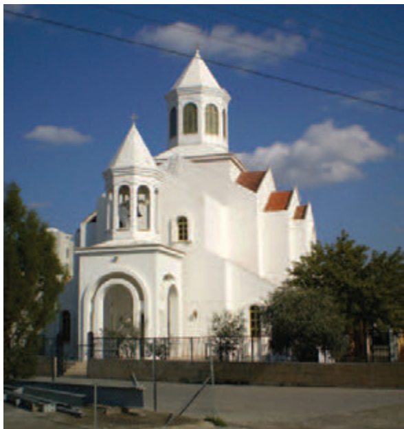
• Ο καθεδρικός ναός της Παναγίας στη Λευκωσία (2012).