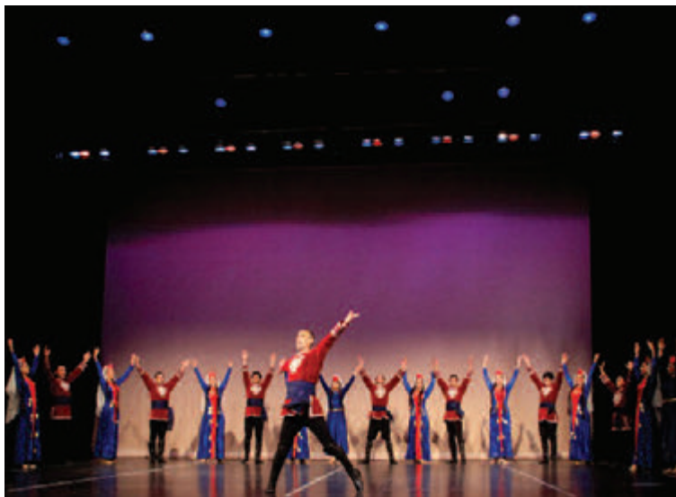
• Η φημισμένη χορευτική ομάδα «Σιπάν» (2015).