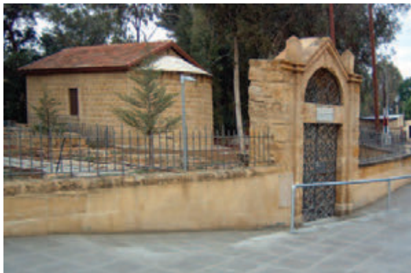
• Το παρεκκλήσι του Αγίου Παύλου και η εντυπωσιακή πύλη του παιλιού αρμενικού κοιμητηρίου στη Λευκωσία (2010).