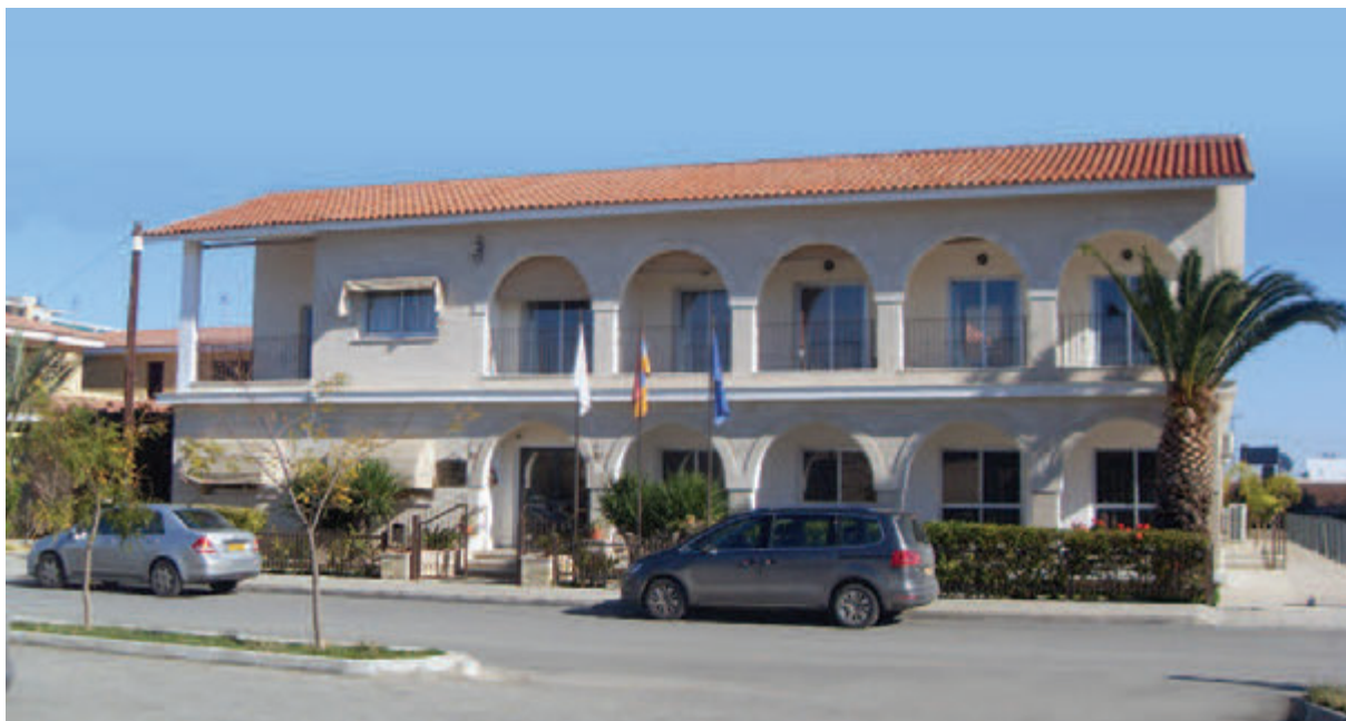
● Το Μέγαθο Ευγηρίας Καθαϊτζιάν (2012).