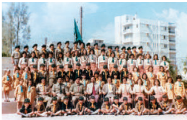
● Το 4 ο Σύστημα Προσκόπων Κύπρου του Σχολείου Ναρέκ Λευκωσίας (1976).